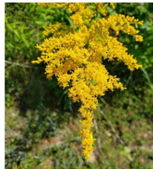
Goldrute (mehrere Arten)